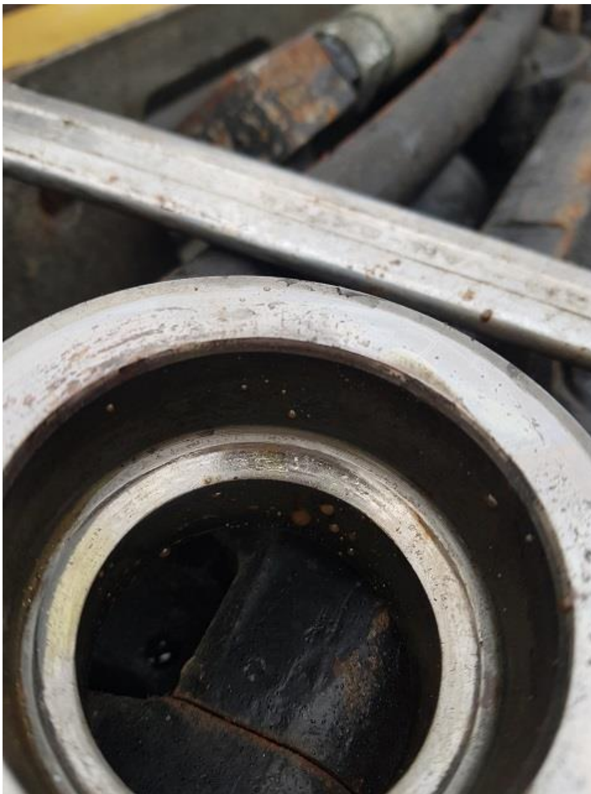
Sliten stoppring i bormaskinen på bom 1