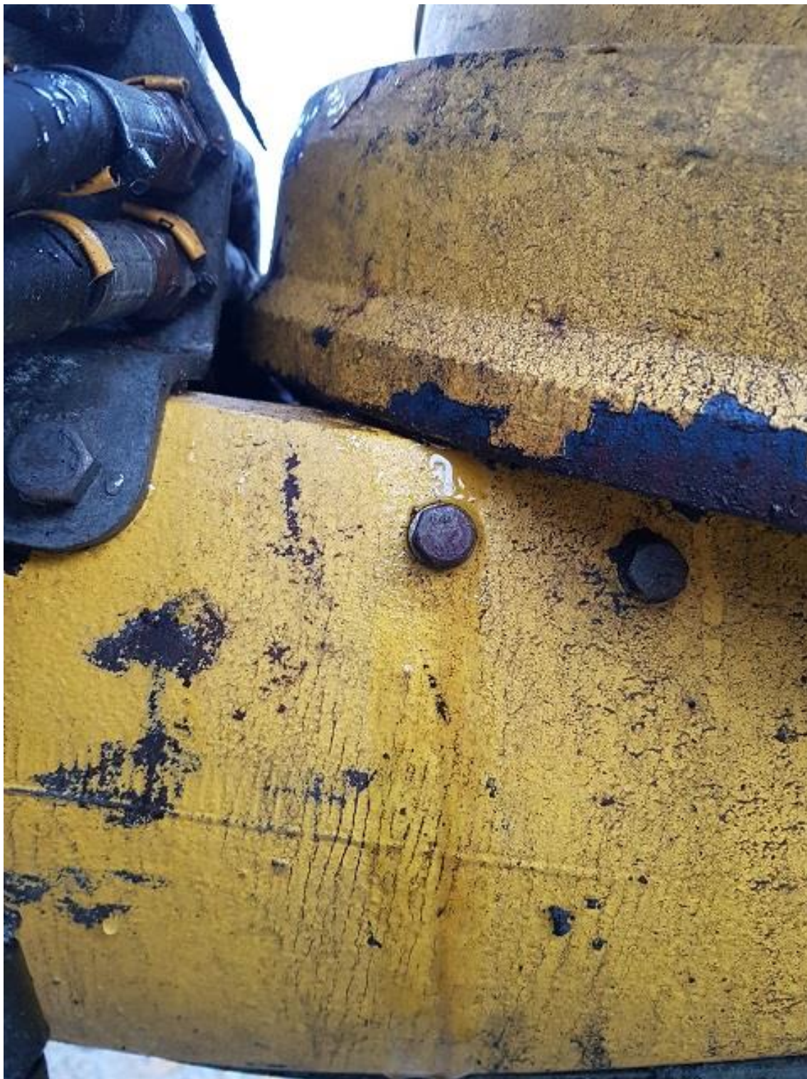
Läcker olja vid vriddonet på bom 1