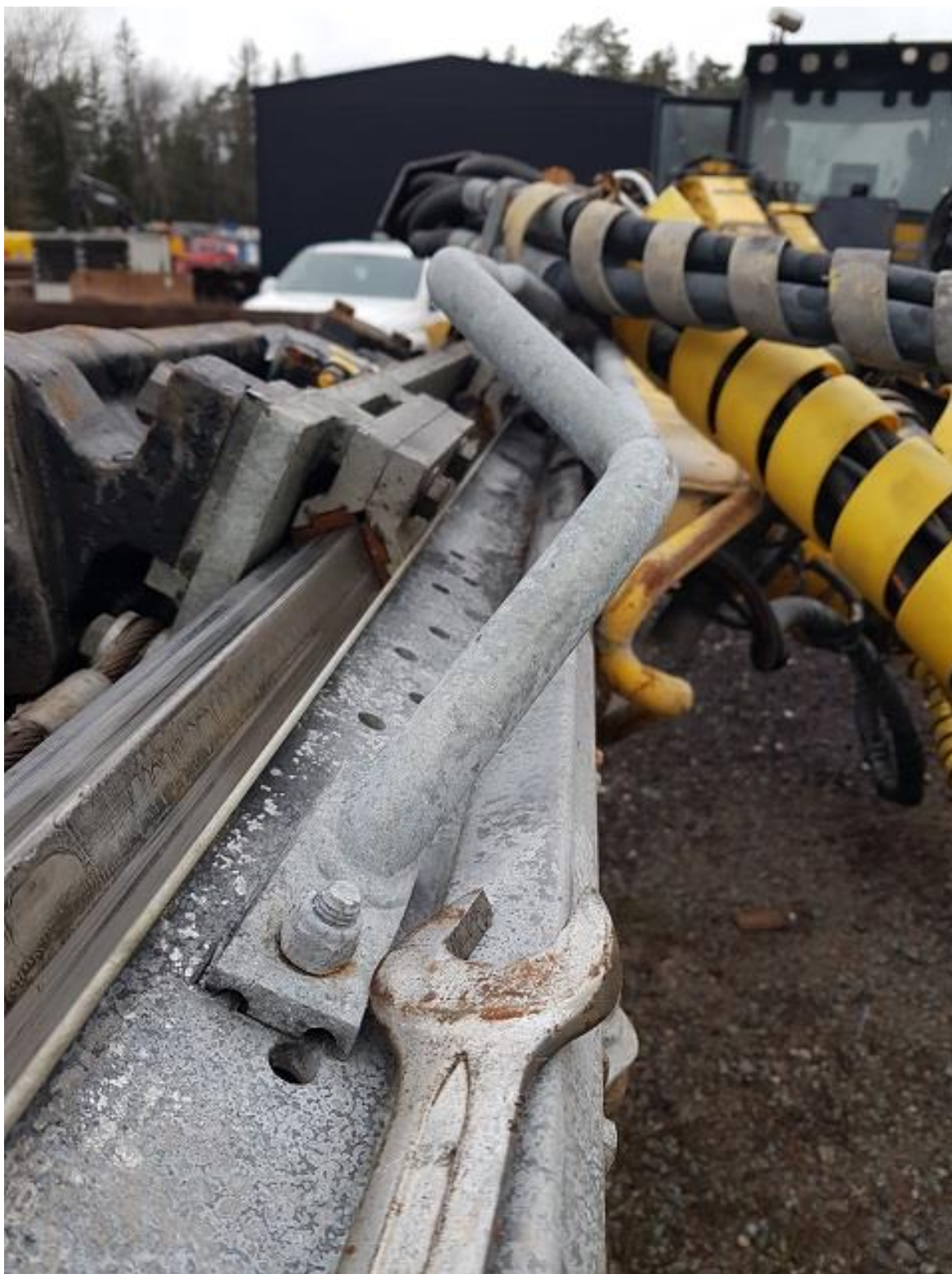
Slangstyrare böjd på matare 2