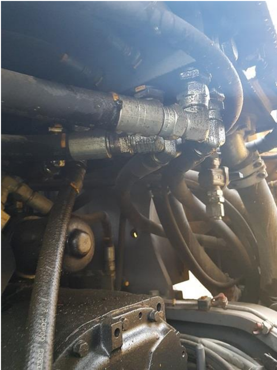
Oljekladdigt under hydrautanken.