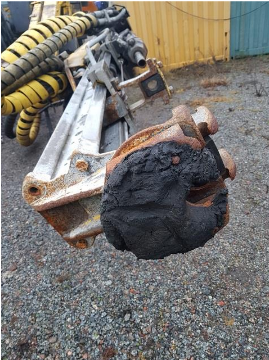
Lite slitet borrhöd och dubb samt saknas bult mot matarbalken