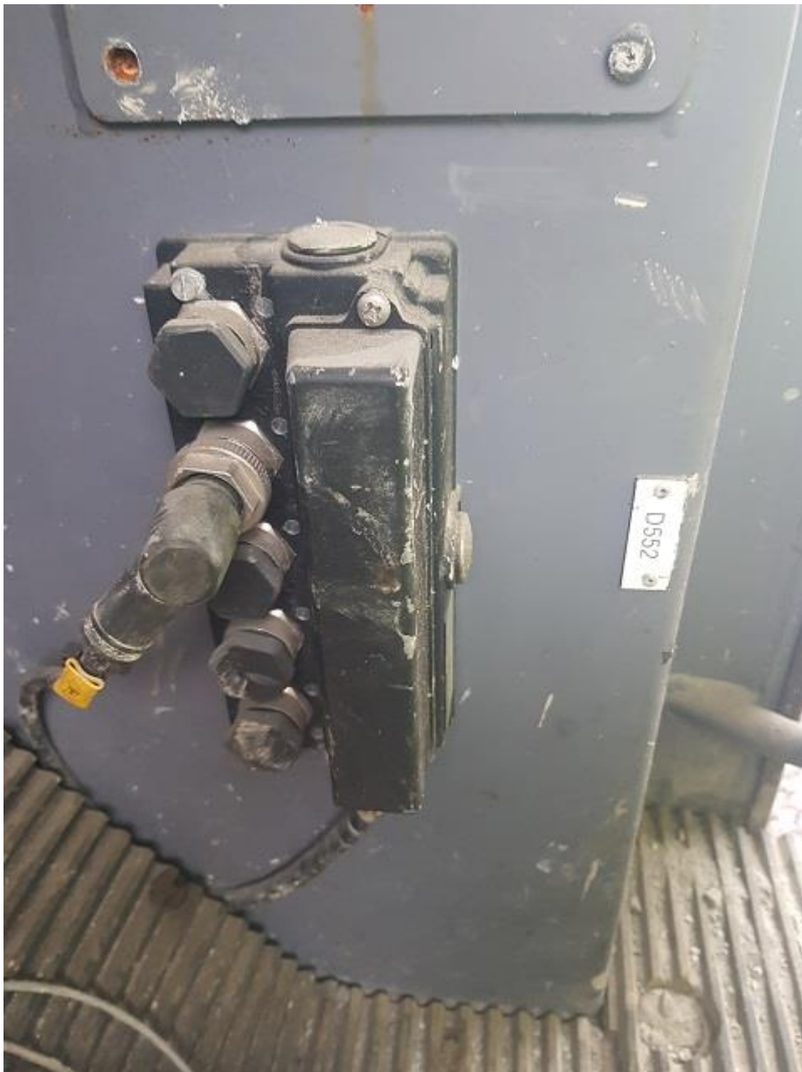
Kontakt trasig och är lös på säkringslåda till RCS systemet i hytten