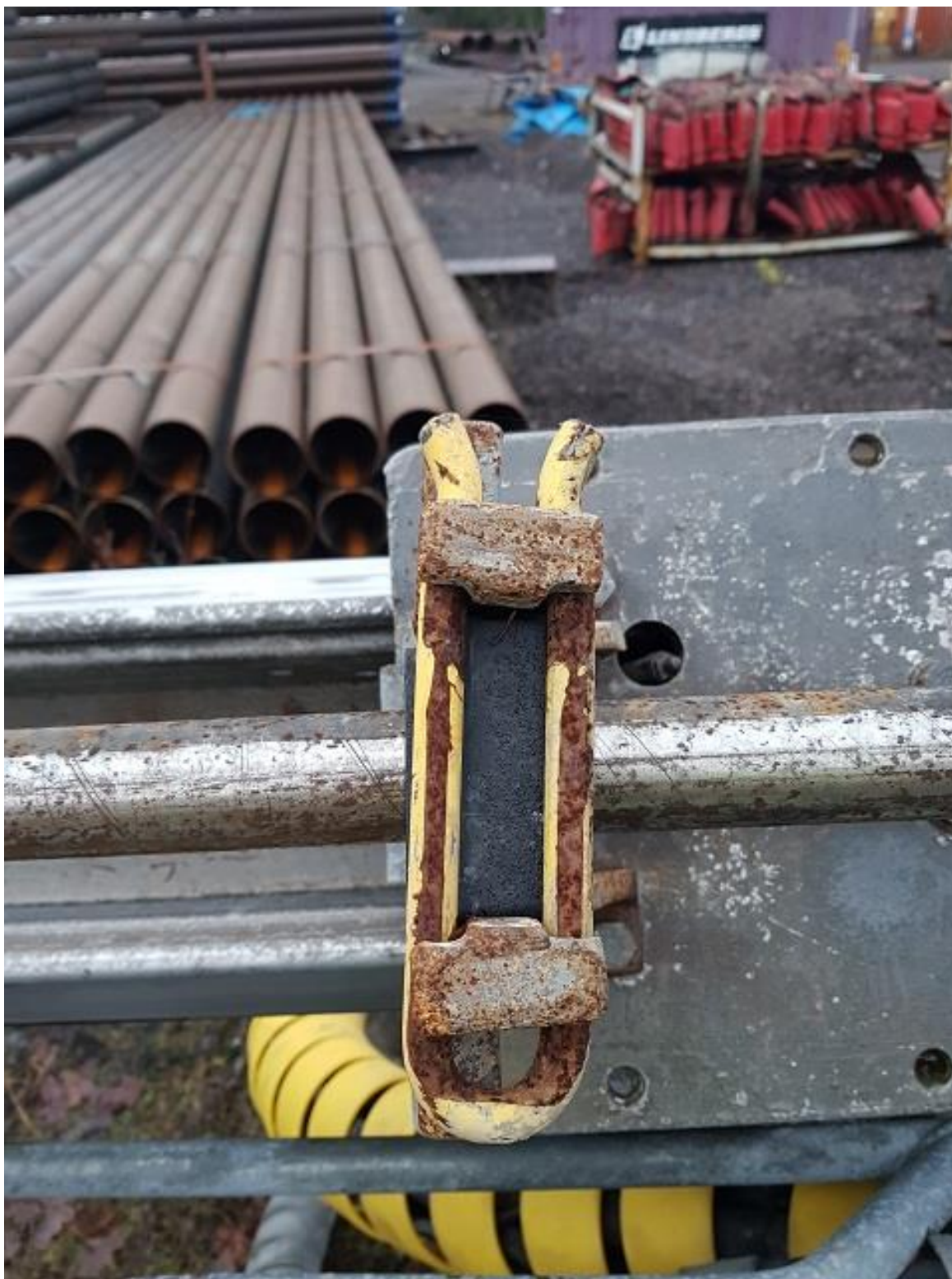
Bakre borrhöd böjt på matrare 2