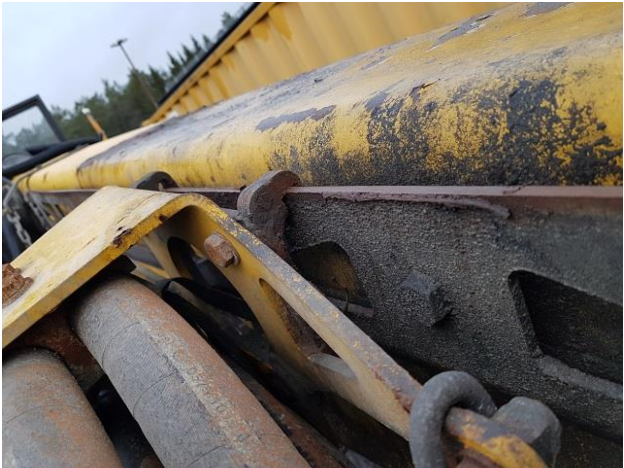
Slitna glidstycken på bom 1