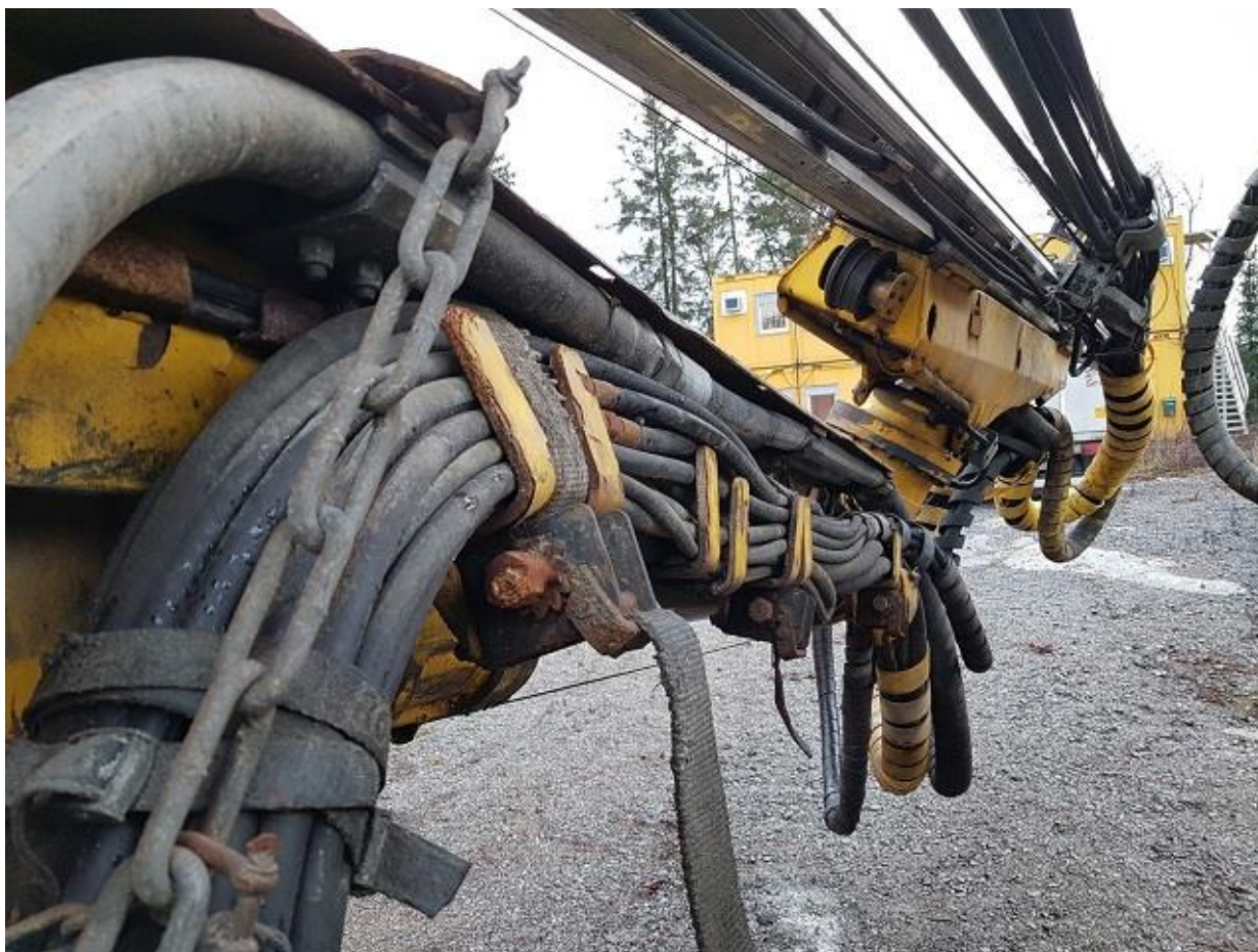
Allmänt böjda fästen och hållare på bom 1