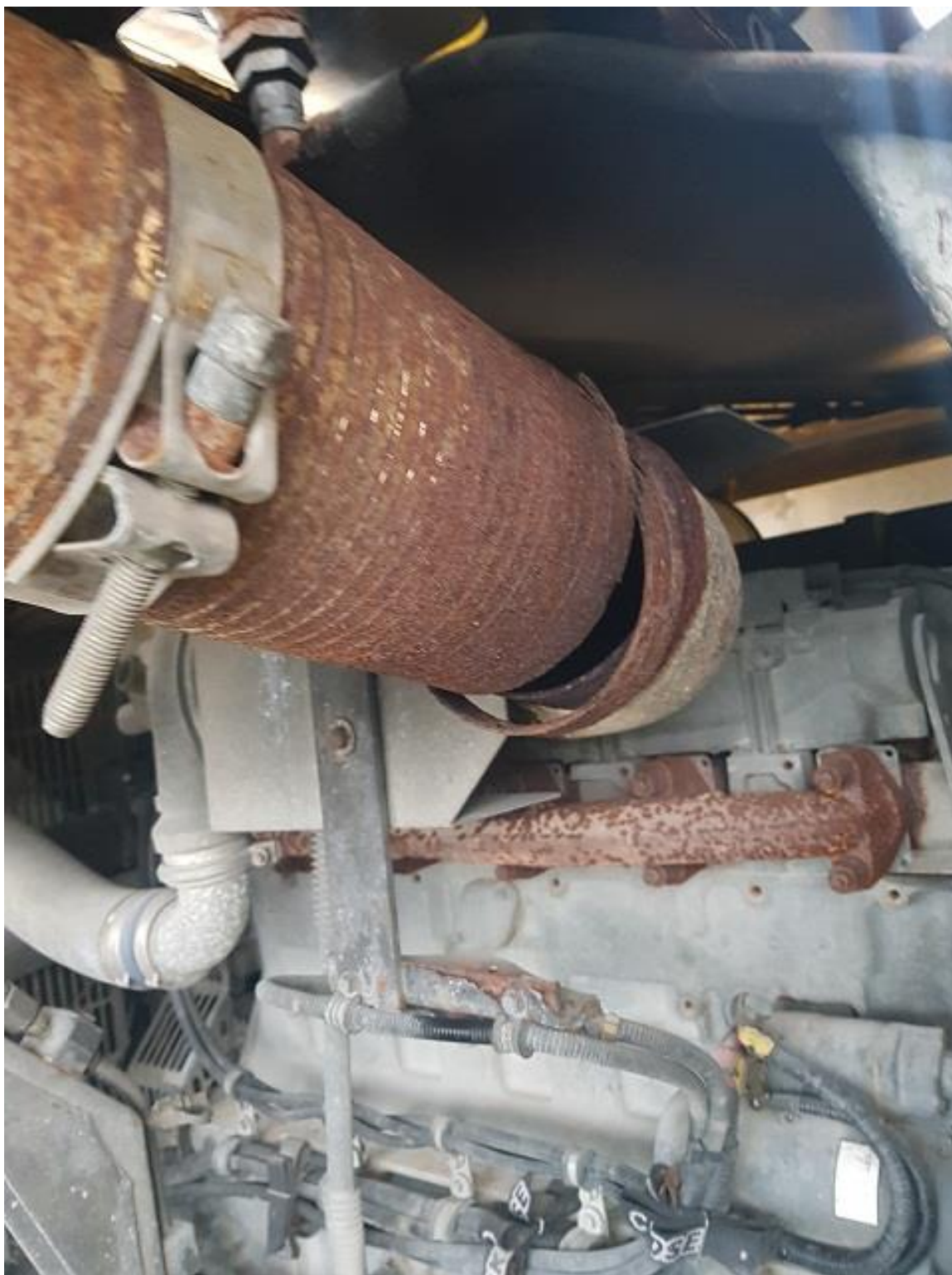
Flexrör mellan turbo och ljuddämpare trasigt.