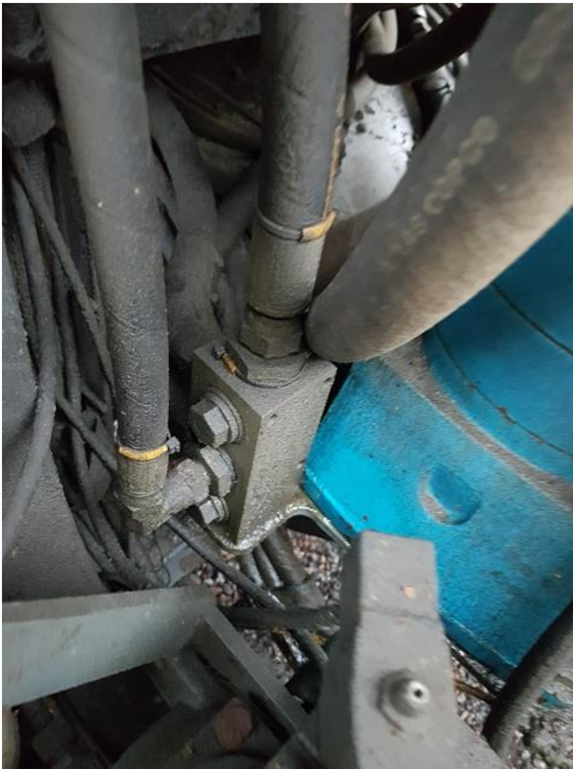
Läcker olja vid tryckblock vid vattenpumpen