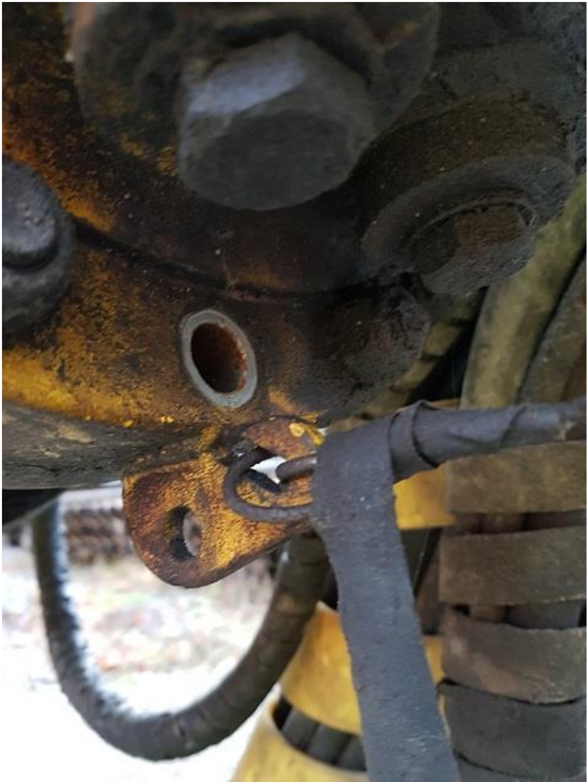
Saknas bult vid vridon