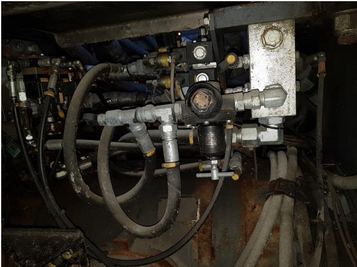
Manometer trasig på smörjlufttrycket.