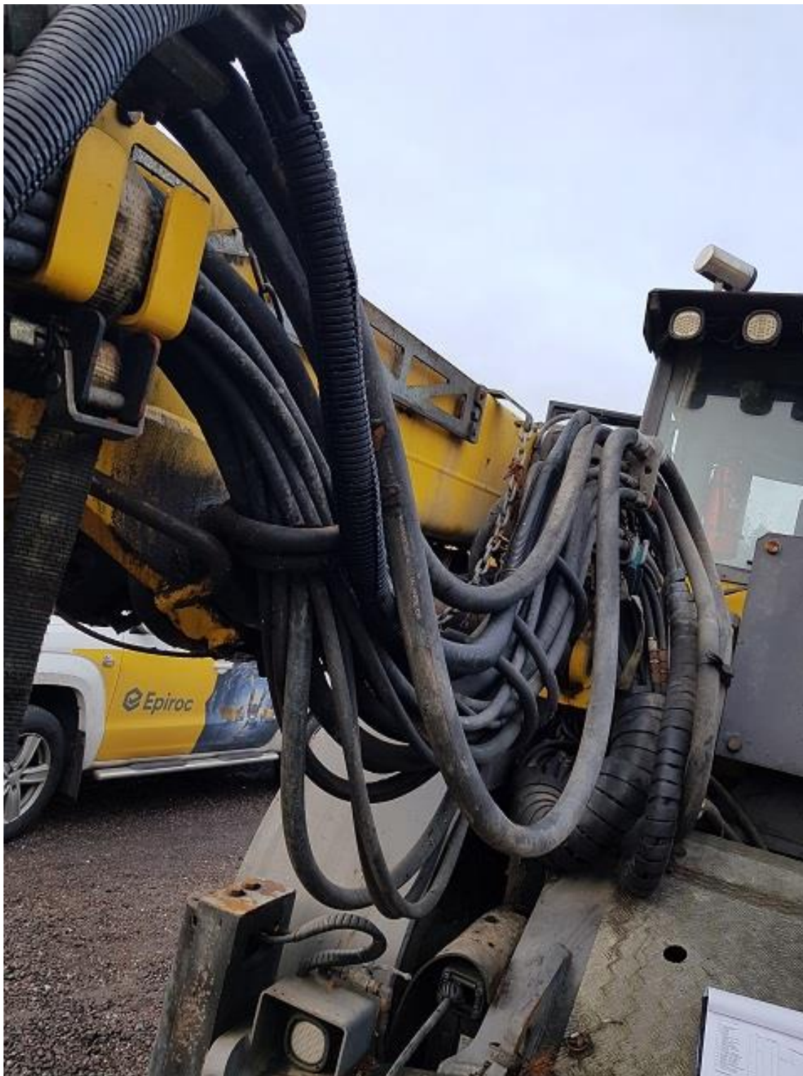
Diverse tillsnyggning av slangpaket på bom 2