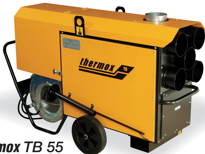
thermox TB 55

• byggplatser • industrierhallar • lantbruk • växthus