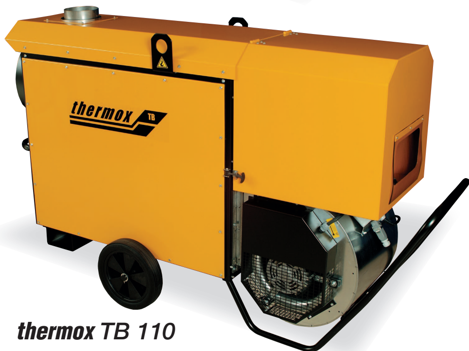
thermox TB 110