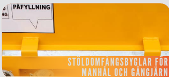
STÖLDOMFÅNGSBYGLAR FÖR MANHÅL OCH GÅNGJÄRN