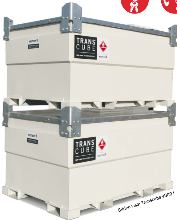
Bilden visar Transcube 3000 I