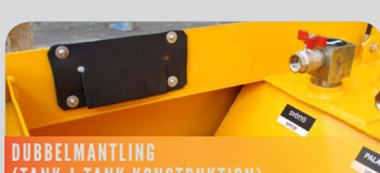
DUBBELMANTLING (TANK-I-TANK KONSTRUKTION)