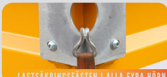
LASTSÄKRINGSFÄSTEN I ALLA FYRA HÖRN