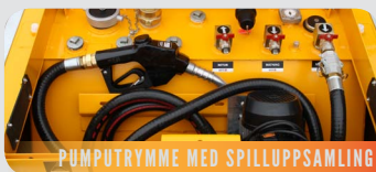
PUMPUTRYMME MED SPILLUPPSAMLING