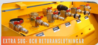
EXTRA SUG- OCH RETURANSLUTNINGAR