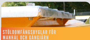
STÖLDOMFÅNGSBYGLAR FÖR MANHÅL OCH GÅNGJÄRN